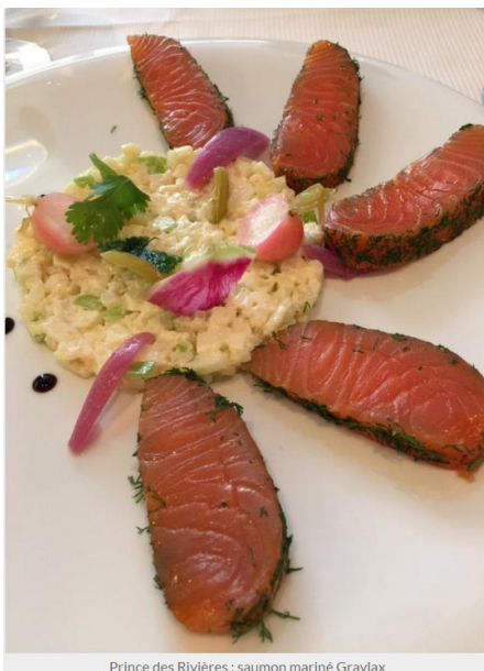
Prince des Rivières : saumon mariné Gravlax

En salle, un service précis, élégant, intelligent et un retour aux sources avec découpe ou flambage en salle. Ce petit côté suranné du service en salle est délicieux et offre un spectacle à l'assemblée. La découpe de mon saumon Gravlax a eu un franc succès !