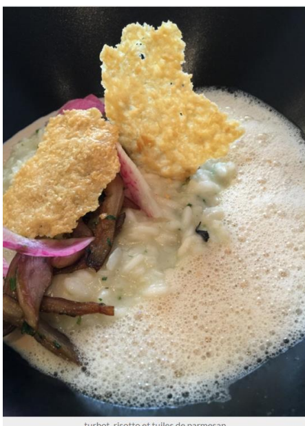
turbot, risotto et tuiles de parmesan