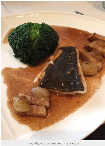
magnifique turbot nacré cuit au sautoir