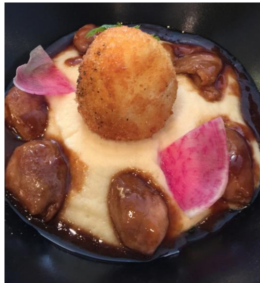
Nid d'Amour : oeuf biologique croustillant, sot l'y laisse rôtis, panais