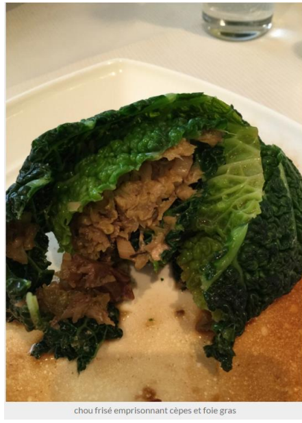
chou frisé emprisonnant cèpes et foie gras