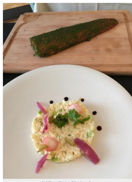
la bête prête à se faire trancher