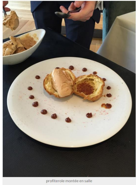
profiterole montée en salle